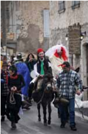
Φίλοι και συγγενείς συνοδεύουν τη «νύφη» στην εκκλησία, πάνω σε γαϊδούρια υπό τον ήχο κουδουνιών

✓ Την Κυριακή 26 Φεβρουαρίου 2012 , μικροί και μεγάλοι διασκεδάσαν στις αποκριάτικες εκδηλώσεις στην πλατεία της Στεμνίτσας. «Του Κουτρούλη» ο γάμος στέφτηκε με απόλυτη επιτυχία. Όλοι οι παρευρισκόμενοι χόρεψαν στο τεράστιο γαϊτανάκι, που είχε φτιαχτεί με πολύ μεράκι. Η προσφορά του παραδοσιακού «τσουκαλόκαυτου» ενίσχυσε την εορταστική διάθεση του κόσμου. Το Σωματείο των Επαγγελματιών Στεμνίτσας, η Δι-