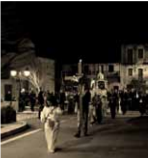
Σκηνές κατάνυξης της Μ. Παρασκευής.