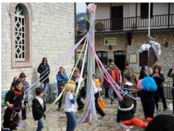
Το γαϊτανάκι διασκέδασε μικρούς και μεγάλους

σε επαφή με το Σύλλογο Αρκάδων Ορειβατών Οικολόγων. Υλοποιήθηκε με την υποστήριξη του Ιδρύματος «Χρήστου Βασιλείου Ρούνιου» και του Πολιτιστικού Συλλόγου Στεμνιτσιωτών «Ο Ψούντας». Η αξιοποίηση του έργου θα γίνει από όλους όσους περπατήσουν αυτό το μοναδικής ομορφιάς μονοπάτι, το οποίο τα τελευταία 15 χρόνια είχε εγκαταλειφθεί, όπως και πολλά