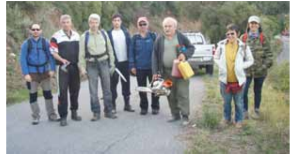
Η ομάδα εθελοντών σε μια αναμνηστική φωτογραφία