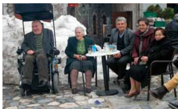
Με φόντο τους όγκους του χιονιού -απόδειξη της φετινής βαρχειμωνιάς- η παρέα των Στεμνιτσιωτών, διασκεδάζει, παρακολουθώντας τα δράματα

Η ακολουθία της Μ. Τρίτης, τελέστηκε από