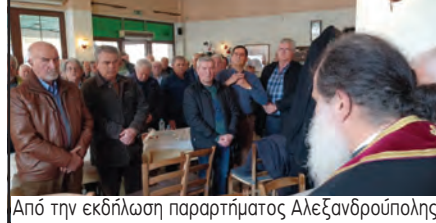
Από την εκδήλωση παραρτήματος Αλεξανδρούπολης