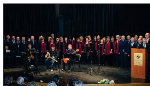
«Δεν έχω συγκινηθεί ποτέ τόσο πολύ σε κανένα άλλο μνημόσυνο»

Ήταν η φράση που κυριάρχησε στους θεατές - ακροατές μας, μετά τη συναυλία - μνημόσυνο που πραγματοποιήσε η χορωδία μας, για τα θύματα του τραγικού σιδηροδρομικού δυστυχήματος στα Τέμνη, το Σάββατο, 24 Φεβρουαρίου 2024, στο αμφιθέατρο της Δημοτικής Πινακοθήκης Λάρισας. Την εκδήλωσή μας, εκτός του πλήθους των συναδέλφων και φίλων, τίμησαν με την παρουσία τους ο Δήμαρχος Λάρισας και Πρόεδρος της Δημοτικής Πινακοθήκης, ο Αντιπεριφερειάρχης Πολιτισμού Λάρισας, εκπρόσωπος του Μητροπολίτη Λαρίσης και Τυρ-