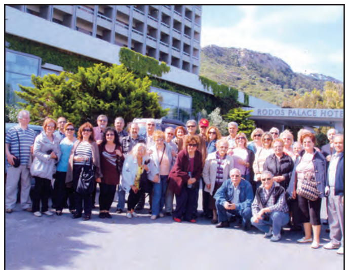
Ρόδος 13/5/2011 Ξενοδοχείο "ΡΟΔΟΣ ΠΑΛΑΣ" Εκδρομή ΣΣ ΜΑΚ. - ΘΡΑΚΗΣ

Όπως όλες οι εκδρομές που διοργάνωσε ο Σύνδεσμος Συνταξιούχων Σιδηροδρομικών ΜΑΚΕΔΟΝΙΑΣ - ΘΡΑΚΗΣ είχαν μεγάλη επιτυχία, έτσι και η εκδρομή στο νησί της Ρόδου. Τα μέλη μας ευχαριστήθηκαν πολύ που πήραν μέρος σε αυτήν. Το πολύ μικρό κόστος της συμμετοχής (330 ευρώ το άτομο για 5ήμερη διαμονή με ημιδιατροφή σε ξενοδοχείο 5 αστέρων, αεροπορικά εισιτήρια, ξενάγηση), και η άρτια και με μεράκι οργάνωσή της από την θυγατέρα του συναδέλφου μας Ιωακείμδη Χαράλαμπου, θα μας μείνει αξέχαστη και την ευχαριστούμε θερμά. Θα αναφέρουμε ότι καθημερινά είχαμε την υπεύθυνη ενημέρωση ξεναγού, που μας άνοιξε έναν μεγάλο κύκλο γνωριμίας με τον λόφο του Μόντε Σμιθ, τα αρχαία ερείπια της Ακρόπολης, του Ναού του Απόλλωνα, του Αρχαίου Σταδίου, την Μεσαιωνική πόλη της Ρόδου, της πόλης των Ιπποτών, το παλάτι του Μεγάλου Μάγιστρου. Συνεχίζοντας επισκεφτήκαμε τη γραφική Λίνδο με την πλούσια παραδοσιακή νησιώτικη αρχιτεκτονική, την Αρχαία Ακρόπολη με τα ανηφορικά και στενά δρομάκια, καθώς και τη πολυτάραχη ιστορία της, το κοσμοπολίτικο θέρετρο Φαλυράκι. Επισκεφτήκαμε το όμορφο νησί της Σύμης με στάση στον Πανορμίτη. Η ξενάγηση συνεχίζεται στα ερείπια της αρχαίας Καμείρου, τη Φιλήρημο και τη γεμάτη φυσική ομορφιά κοιλάδα με τις πεταλούδες και τελειώνει με την επίσκεψη στο ενυδρείο.