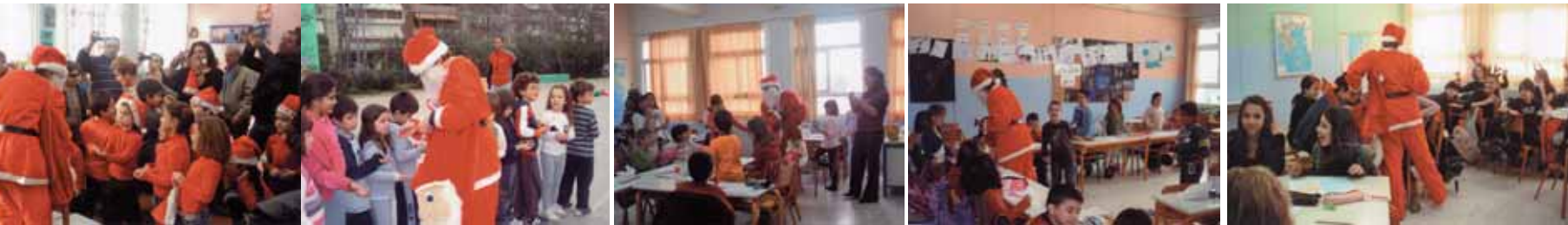
Ο ΑΓΙΟΣ ΒΑΣΙΛΗΣ ΣΤΑ 144-163 ΔΗΜΟΤΙΚΑ ΣΧΟΛΕΙΑ.