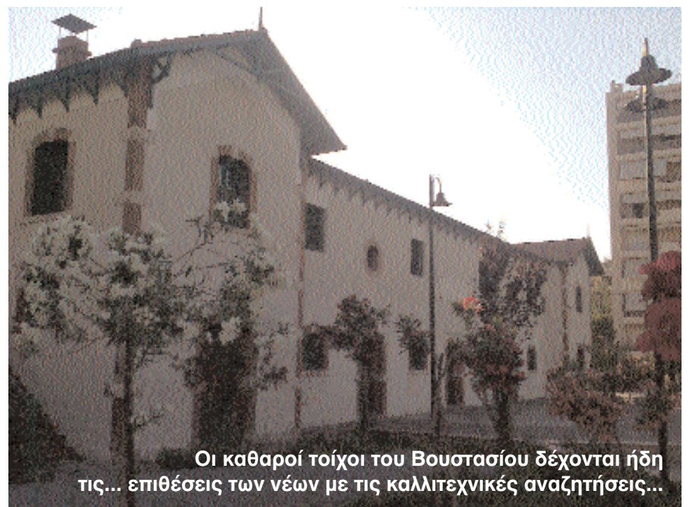
Οι καθαροί τοίχοι του Βουστασίου δέχονται ήδη τις... επιθέσεις των νέων με τις καλλιτεχνικές αναζητήσεις...

Και μια επισήμανση με την ευκαιρία: Τα δέντρα στο παρκάκι μπροστά από το Βουστάσιο θέλουν ψέκασμα.