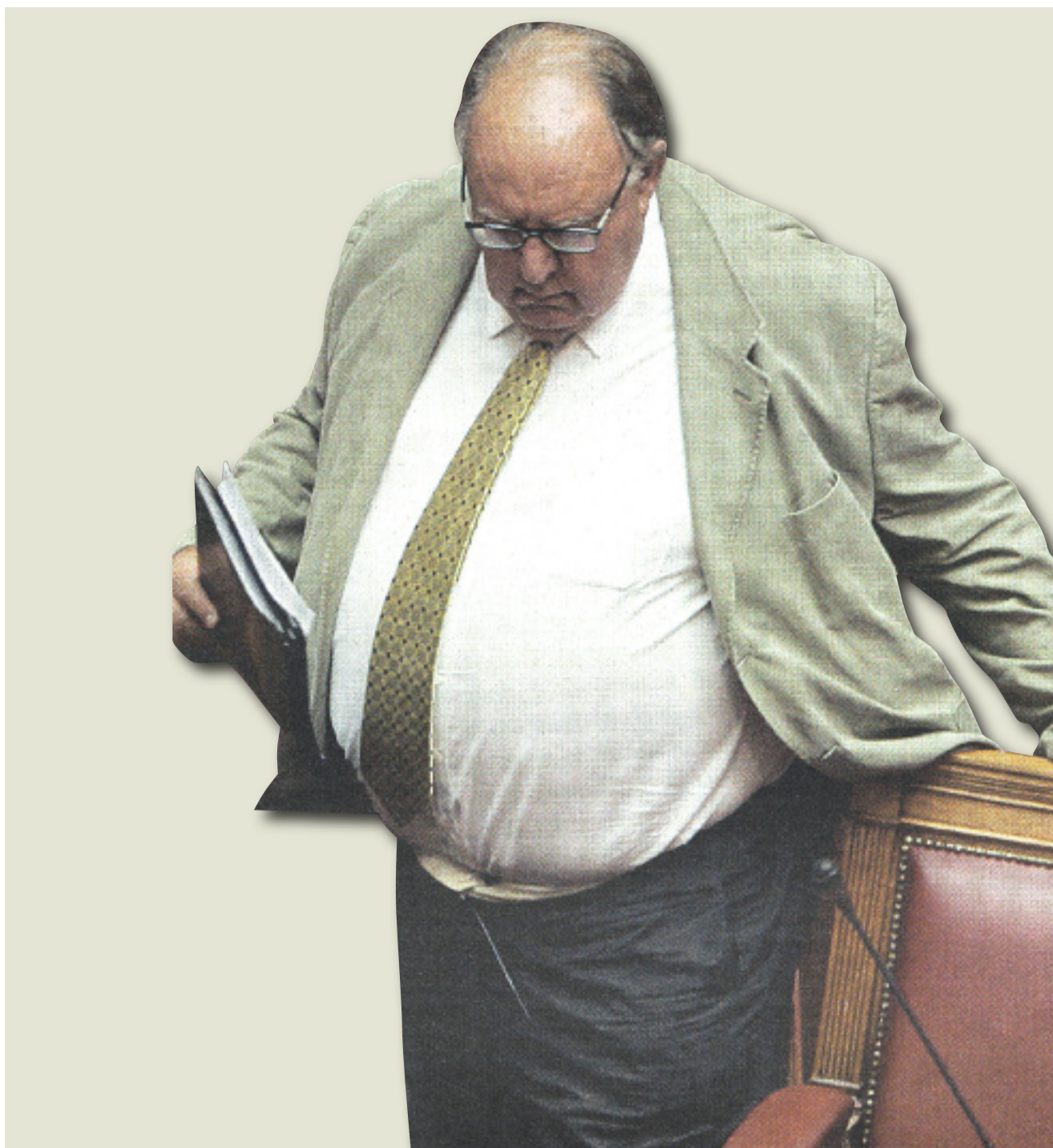
Προς τον «Αξιότιμο» Αντιπρόεδρο της Ελληνικής Κυβερνήσεως