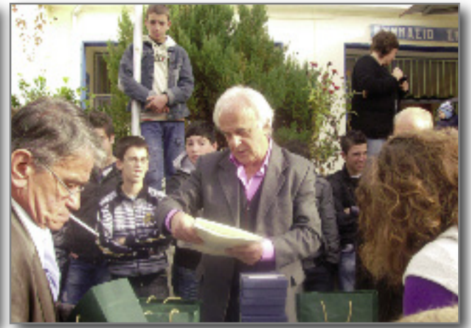
Ο πρόεδρος και τα μέλη του Δ.Σ. του Σωματείου κατά την διάρκεια της βράβευσης των μαθητριών και μαθητών στο Γυμνάσιο Σμίνθης.