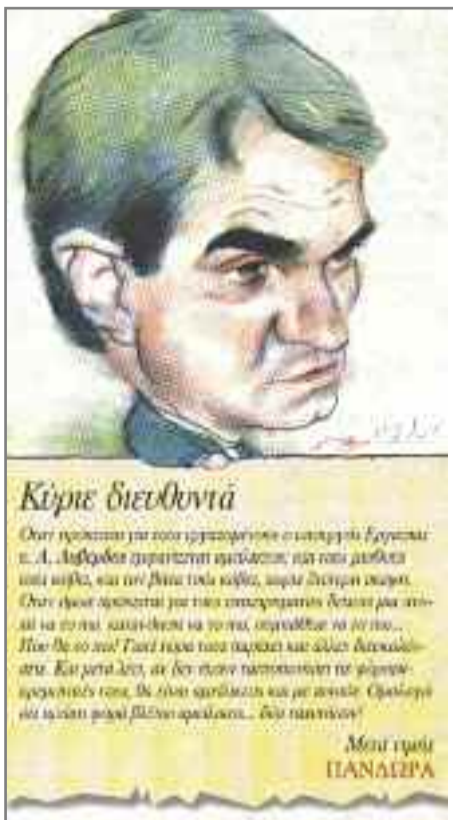
Από την εφημερίδα «ΤΟ ΒΗΜΑ», 13-8-2010