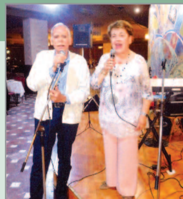
Νέα αστέρια του πενταγράμμου στο στερέωμα

Μόνο μία εκδρομή πραγματοποιήσε στο Σωματείο μας τους μήνες Απρίλιο – Μάιο, ασφαλώς για αυτό ευθύνονται τα αλλεπάλληλα μνημόνια τα οποία έχουν γονατίσει οικονομικά όλους μας και για το μόνο που φροντίζει σήμερα ο κάθε συνταξιούχος είναι ο επιούσιος άρτος και αφήνει για μετά θάνατο τα θεάματα. Βέβαια μεσολάβησαν οι εκλογές του Σωματείου μας καθώς και οι γιορτές του Πάσχα όπου πολλοί συνάδελφοι μας μετέβηκαν στους τόπους καταγωγής των για να γιορτάσουν μαζί με τους δικούς τους τις άγιες μέρες. Κυριότερη αιτία όμως είναι η οικονομική κρίση καθώς και η αβεβαιότητα που πλανάται μη γνωρίζοντας τι μέλλει γενέσθαι αύριο.