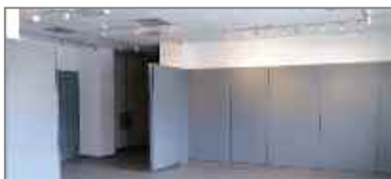
Από τους χώρους της επέκτασης του Μουσείου.

Το Διοικητικό Συμβούλιο της Εταιρίας στην 808/18-4-2011 συνεδρίαση του αποφάσισε ομόφωνα να μας παραχωρηθούν οι νέοι χώροι της επέκτασης του Μουσείου.