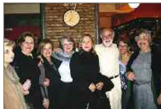
Ο Μπαλούς μ' ένα ωραίο μπουκέτο δεσποινίδων της Λέσχης. Τις γνωρίζετε; Σίγουρα ναι.

στο θέατρο "Ημέρας", έστω και με μια Πέμπτη κάθε μήνα, όπου να γίνεται κάποια εκδήλωση ή και απλή συνάντηση.