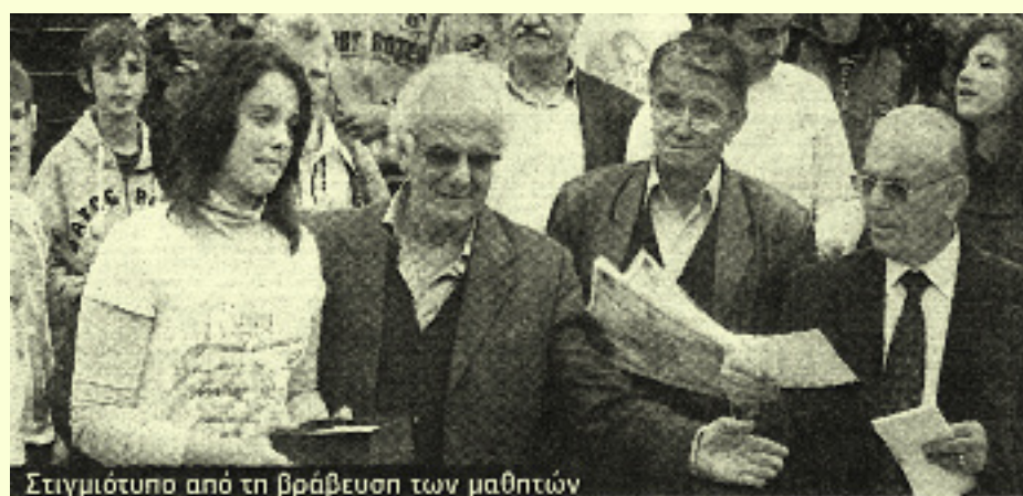
Στιγμιότυπο από τη βράβευση των μαθητών