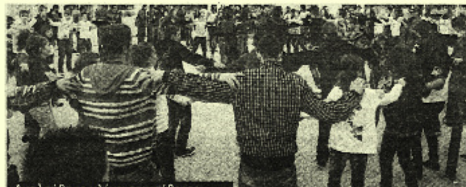
Από την εφημερίδα ΕΜΠΡΟΣ της Ξάνθης

διά - όλους τους αριστούχους. Φέτος ήρθαν 47 συνταξιούχοι και τα ετοίμασαν όλα ...Νόστιμα εδέσματα, μουσική και προπαντός έκδηλα αισθήματα αγάπης. Σε μια συγκινητική ατμόσφαιρα βραβεύτηκαν 17 μαθητές. Μάλιστα για να μην αφήσουν παραπονεμένους τα παιδιά εκτός Γυμνασίου τους μοίρασαν δώρα ως Α Βασίληδες!