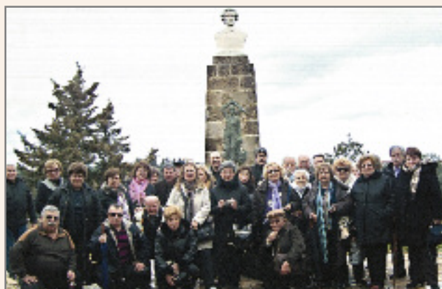
Από την εκδρομή της Ζακύνθου.

Τους μήνες Φεβρουάριο – Μάρτιο πραγματοποιήθηκαν οι παρακάτω εκδρομές: