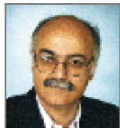
Του Κ. Α. Ναυπιώτη

υπόδειξη που έγραφε « οδηγέ πριν εκκίνησης δοκιμάσες την πέδη »! Η πέδη λοιπόν είναι φανερό ότι συγκρατεί τους τροχούς για να πεδίσει (δηλ. να σταματήσει με ασφάλεια) το τραίνο ή το αυτοκίνητο... Αυτός που πεδίσει λέγεται τροχοπεδητής . Σχετική είναι και η λ. πέδικλο (το) (χιώτ.διπούζες) με την έννοια ότι