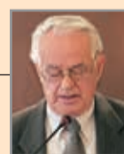
Του Προέδρου Ευθυμίου Ρουσιά

Η μεσαία τάξη ζούσε ήσυχα και όχι δαπανηρά. Λίγη ρετσίνα και ένα πιάτο στραγάλια ή για πολυτέλεια λίγα