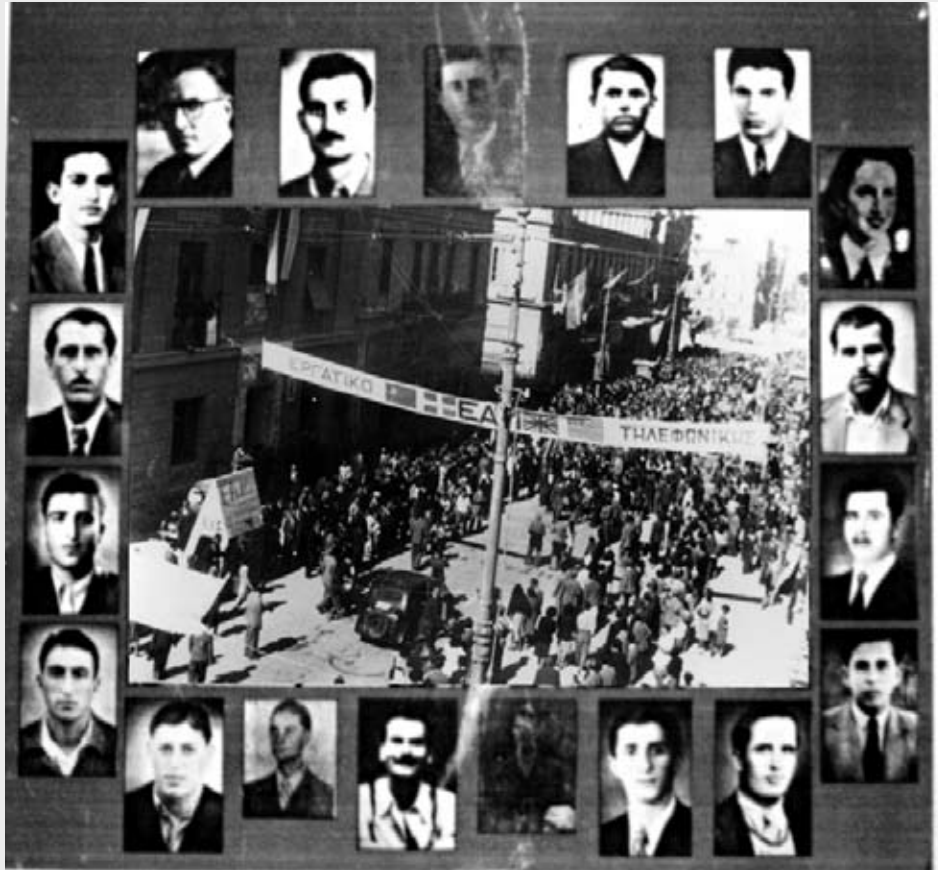
Σεπτέμβρης 1944. Στο κέντρο η Αθήνα μετά την απελευθέρωση. Σταδίου 15 Μέγαρο ΑΕΤΕ. Οι 15 ηρωικού συνάδελφοι της Τηλεφωνικής που εκτελέστηκαν στην Καισαριανή στις 7 Μαΐου 1944.