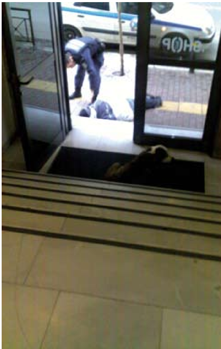
Η είσοδος στο ΤΕΚ Καρόλου.