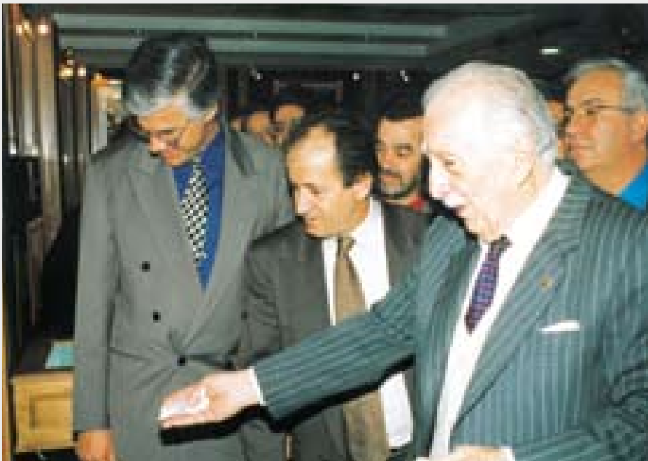
1996. Στο φωτογραφικό στιγμιότυπο ξεναγεί το τότε Πρόεδρο της ΓΣΕΕ Χρήστο Πολυζωγόπουλο στην έκθεση ιστορικής μνήμης που οργάνωσε η ΠΕΤ-ΟΤΕ.

βήματα για να καθιερωθεί στην συνείδηση των Ελλήνων καταναλωτών, σ' ένα ιδιαίτερο περιβάλλον. Να παραδί-δει το βιβλίο με τα πρακτικά ίδρυσης σε ένα συνέδριο του ΕΚΑ. Να είναι παρών στις Συνελεύσεις Αντιπροσώπων, ιδιαίτερα τότε που είχαμε οργα-νώσει έκθεση φωτογραφίας με όλα αυτά τα ντοκουμέντα.