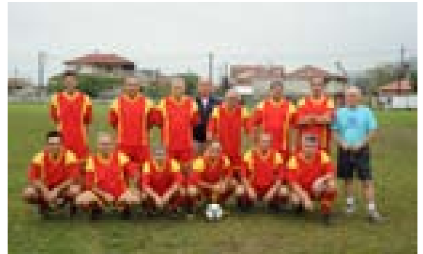
Η ποδοσφαιρική ομάδα της Κύπρου ΤΕΥ ΑΤΤΙΚ κυπελλούχος στην Τέμενη.