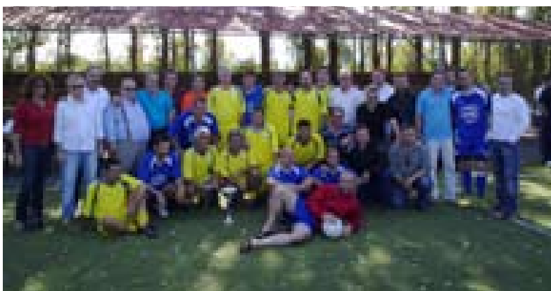
Αναμνηστική φωτογραφία των ομάδων της ΤΕΥ ΑΤΤΥΚ και του Πολιτιστικού Κέντρου Αττικής μαζί με τις διοικήσεις τους.