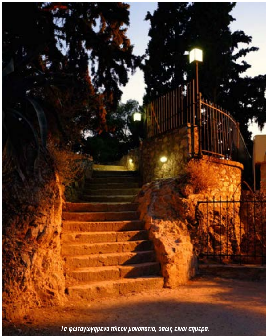
Τα φωταγωγημένα πλέον μονοπάτια, όπως είναι σήμερα.

Αξίζει να σημειωθεί ότι οι τεχνικοί τού ΟΤΕ καθ'όλη την διάρκεια τών εργασιών,