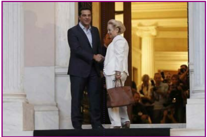
Υπηρεσιακή πρωθυπουργός ορκίστηκε η Βασιλική Θάνου Χριστοφίλου, η οποία αμέσως μετά την τελετή ορκωμοσίας υπέγραψε το πρωτόκολλο ανάληψης των καθηκόντων της.

Μέσα από την εμπειρία που της προσέφερε η διδασκαλία της στη Σχολή Δικαστών, έχει επισημάνει ότι δεν αρκεί να μπει κανείς στο δικαστικό σώμα μόνο προς βιοπορισμό, όπως ίσως δυστυχώς να συμβαίνει τώρα λόγω και της μεγάλης οικονομικής κρίσης. «Αν δεν έχει μεράκι και αγάπη για τη Δικαιοσύνη, δηλαδή για το ιδανικό της