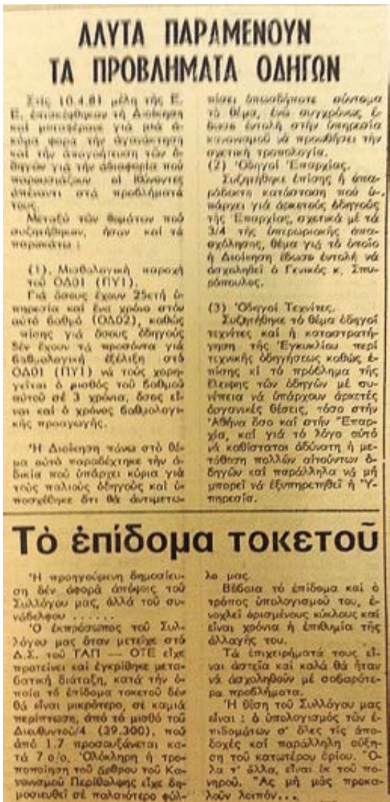
Τα δημοσιεύματα είναι από τη ΦΩΝΗ ΤΩΝ ΤΕΧΝΙΚΩΝ τ. 50, Μάιος 1981

Συνεχίστε να βοηθάτε με τη δική σας συνεισφορά προβάλλοντας τα προβλήματα που αντιμετωπίζετε, είτε στον εργασιακό σας χώρο, είτε στην περιοχή σας. Μόνο έτσι θα κα-