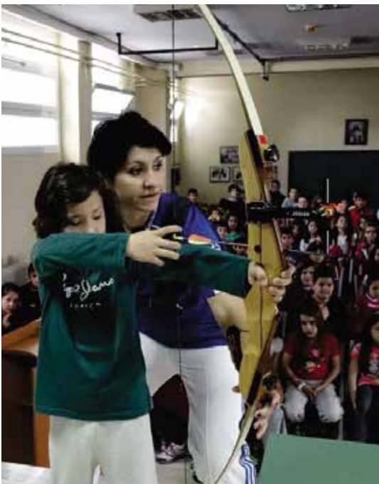
Έπίσκεψη Ολυμπιονικών σε δημοτικό σχολείο της Πιερίας στα πλαίσια του 39ου Συνεδρίου Πολ. Ένωσης Εργ. Ο.Τ.Ε.