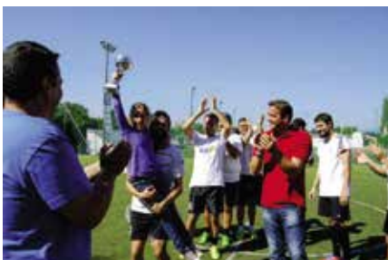
6η Αθλητική Συνάντηση, Παραθεριστικό Κέντρο Ο.ΠΑ.ΚΕ., Τέμενη