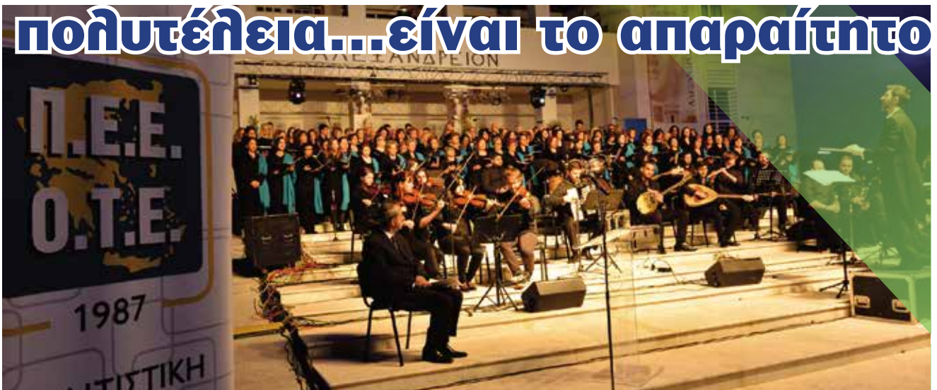
39ο Συνέδριο Πολιτιστικής Ένωσης Εργαζομένων ΟΤΕ, Πιερία