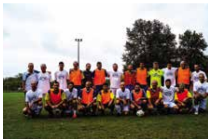
20ο Ποδοσφαιρικό Τουρνουά Π.Ε.Ε. Ο.Τ.Ε. Μακεδονίας - Θράκης, Λουτρά Πόζαρ