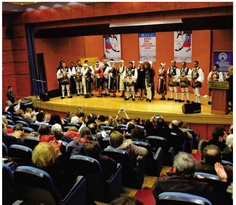
10ο Φεστιβάλ Παραδοσιακών Χορών, Μεσολόγγι