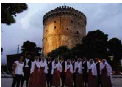
16ο Διεθνές Φεστιβάλ Παραδοσιακών Χορών, Θεσσαλονίκη

γενεών», μέσα από τις πολιτιστικές δράσεις. Παλιοί και νέοι συνάδελφοι καθώς και συνταξιούχοι, με αγαστή συνεργασία, καταβάλουν κάθε προσπάθεια προκειμένου να στηρίξουν τη λειτουργία των πολιτιστικών κέντρων.