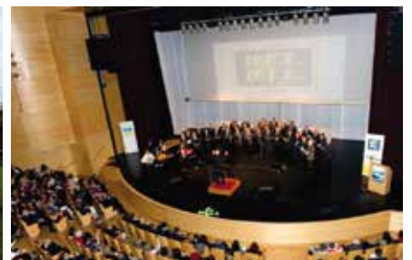
6η Συνάντηση Χορωδιών Ο.Τ.Ε., Κομοτηνή