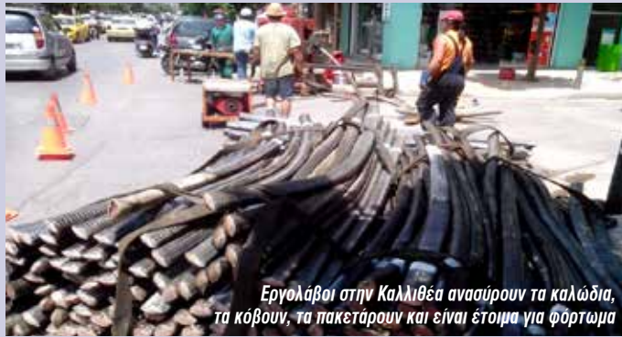
Εργολάβοι στην Καλλιθέα ανασύρουν τα καλώδια, τα κόβουν, τα πακετάρουν και είναι έτοιμα για φόρτωμα

Ήδη έβγαλαν στο σφυρί το κτίριο της οδού Σταδίου 15, το κτίριο της Καλλιθέας στην οδό Δαβάκη, τις παλιές αποθήκες του ΟΤΕ στην Πέ-