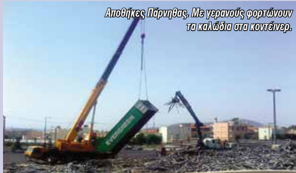
Αποθήκες Πάρνηθας. Με γεραμούς φορτώνουν τα καλώδια στα κοντέινερ.

τρου Ράλλη, το κτίριο της Ν. Κηφισιάς στην οδό Αγραύλης, ένα νεοκλασικό στην παλιά πόλη της Ρόδου ένα κτίριο στον Πύργο και έπεται συνέχεια.