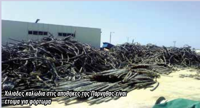
Χιλιάδες καλώδια στις αποθήκες της Πάρνηθας είναι έτοιμα για φόρτωμα