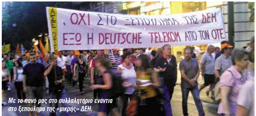
Με το πανό μας στο συλλαλητήριο ενάντια στο ξεπούλημα της «μικρής» ΔΕΗ.

ρίπου 700 στα δυο χρόνια) με ανοικιαζόμενους εργαζομένους και με μισθούς πείνας μέσα από τις δουλεμπορικές θυγατρικές Oteplus, E-Value, OTEglobe κ.λ.π.