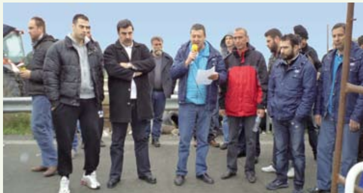
Επάνω: Η Τοπική διοικούσα της ΠΕΤ-ΟΤΕ Νομού Λάρισας δίνει το παρών με ψήφισμα στα μπλόκα των αγροτών, δείχνοντας την αλληλεγγύη της στον δίκαιο αγώνα των αγροτών, σε μια περιοχή της πατρίδας μας που τα προβλήματα των αγροτών επηρεάζουν άμεσα και με τον πιο σκληρό τρόπο την τοπική κοινωνία.