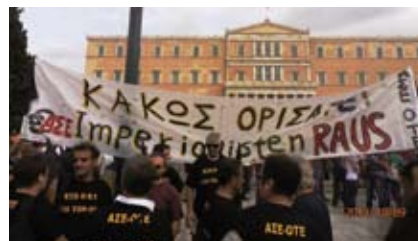
Το πανό μας με το οποίο υποδεχτήκαμε την Μέρκελ

Τη μόνη υπηρεσία που μπορείτε να προσφέρετε πλέον προς τους εργαζόμενους είναι να παραιτηθείτε. Δεν θα το κάνετε όμως γιατί είναι φανερό πια, βρίσκεστε σε διατεταγμένη υπηρεσία. Ντροπή και αίσχος.