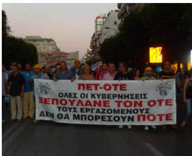
Παρούσα και η ΠΕΤ ΟΤΕ στο συλλαλητήριο της ΔΕΘ με πούλμαν που έβαλε για πρώτη φορά για να εξυπηρετήσει συναδέλφους από την Αθήνα...