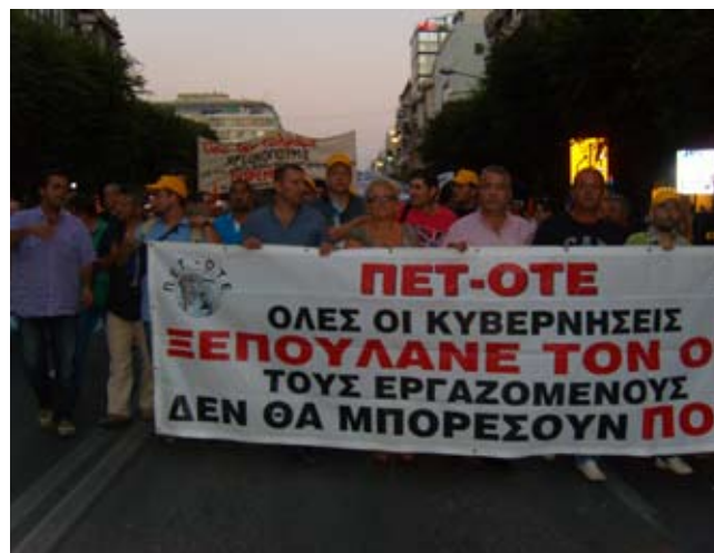
Απεργιακό μπλοκ της ΠΕΤ ΟΤΕ στη ΔΕΘ, άλλη μια κινητοποίηση για τα δίκαια αιτήματα...