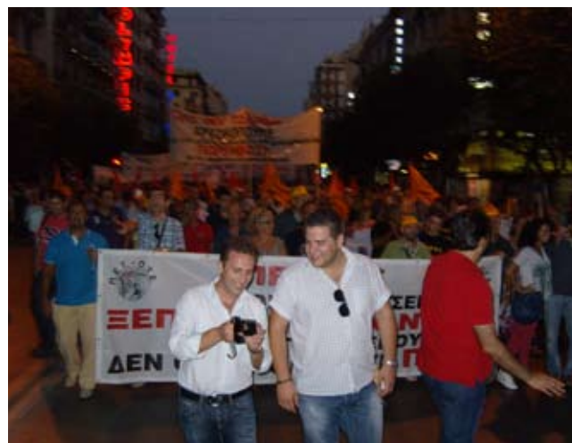
Το πανό μας στη διαδήλωση της ΔΕΘ με τους συναδέλφους στους δρόμους της Θεσσαλονίκης

Τις επόμενες ημέρες θα συνεδριάσουν τα όργανα της Συνομοσπονδίας ώστε να λάβουν αποφάσεις για νέες δυναμικές κινητοποιήσεις.