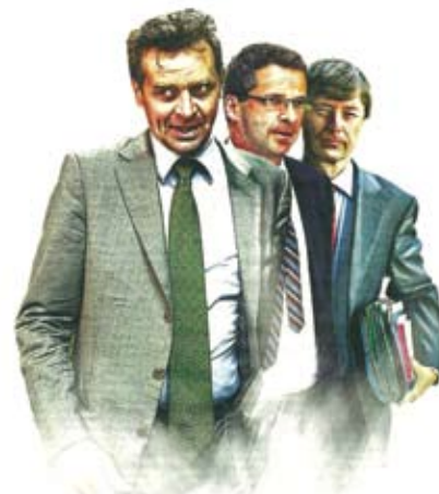
Οι εκπρόσωποι της τριάδας (από αριστερά) Πολ Τόμσεν από το ΔΝΤ, Κλάους Μαζούχ από την ΕΚΤ και ο εκπρόσωπος της Ε.Ε. Ματίας Μορς

Αν ο φόρος βεβαιώνεται τους μήνες Αύγουστο και