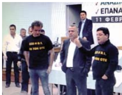
Από την παρέμβασή μας στην 32 η Σ.Α

Στα πλαίσια αυτά και θέλοντας να προσφέρουμε στο σωματείο ζητήσαμε να μας δοθεί το δικαίωμα που απορρέει από τις ψήφους των συναδέλφων να επιλέξουμε μια πρώτη θέση, επιλέγοντας τον Οργανωτικό γραμματέα ή τον Δημοσίων Σχέσεων (που είχαμε και δώσαμε δείγματα γραφής) ή τον Ταμία και όχι μια δεύτερη θέση αναπληρωτή.