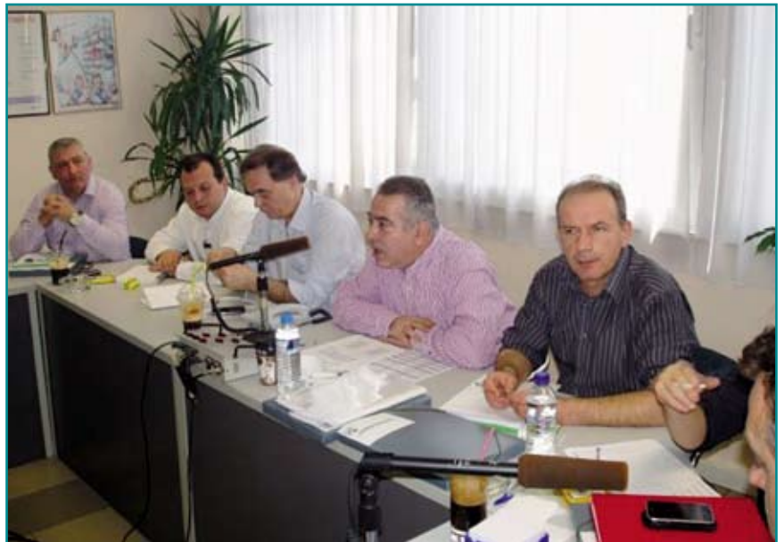
Το νέο Διοικητικό Συμβούλιο της ΠΕΤ-ΟΤΕ, που προέκυψε από τις εκλογές στις 20-24 Φεβρουαρίου 2012