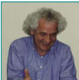
Αναπληρωτής Γραμματέας ο Γιώργος Στεφανής