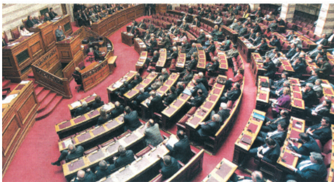
Παρ' όπ η Βουλή έχει λάβει «μέτρα λιτότητας» λόγω της δύσκολης οικονομικής συγκυρίας, συνταξιοδοτικοί νομοβουλευτικοί ζητούν την καταβολή ανοδρομικών και έτσι τέως και νυν βουλευτές θα βρεθούν με παχυλές αμοιβές

Απολαβές 10.270 ευρώ μηνιαίως σε εποχή λιτότητας