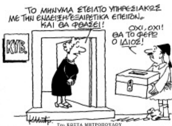
Του ΚΩΣΤΑ ΜΗΤΡΟΠΟΥΛΟΥ