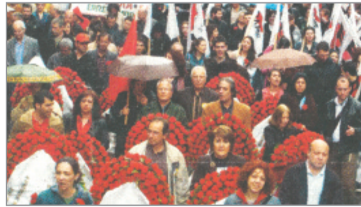
Ξεχωριστές συγκεντρώσεις από ΓΣΕΕ (αριστερά) και ΠΑΜΕ (δεξιά) σε Αθήνα και Θεσσαλονίκη, με τη ΔΑΚΕ να τηρεί αποστάσεις λόγω... προωθημένων αιτημάτων της πλειοψηφίας.

συστηματικά σ' ένα σκοπό. Να εγκαθιδρύσουν σε τούτη τη χώρα μια ολιγαρχία, που πιο δυνατή δεν υπήρξε ποτέ, σε κανένα μέρος της γης.