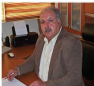
ΦΟΡΟΤΕΧΝΗΣ - ΛΟΓΙΣΤΗΣ ΑΤΑΞΗΣ ΠΡΟΕΔΡΟΣ Ε.Ε. ΕΛΛΗΝΟ-ΙΤΑΛΙΚΟΥ ΕΠΙΜΕΛΗΤΗΡΙΟΥ ΜΕΛΟΣ Δ.Σ. Ε.Ε.Α.

ΤΗΡΗΣΗ ΒΙΒΛΙΩΝ ΚΑΘΕ ΚΑΤΗΓΟΡΙΑΣ ΔΗΛΩΣΕΙΣ ΦΟΡΟΛΟΓΙΑΣ ΕΙΣΟΔΗΜΑΤΟΣ - Φ.Μ.Υ. - Φ.Π.Α. - Ε9 ΕΡΓΑΤΙΚΑ - Ι.Κ.Α. ΕΠΙΛΥΣΗ ΦΟΡΟΛΟΓΙΚΩΝ ΕΛΕΓΧΩΝ