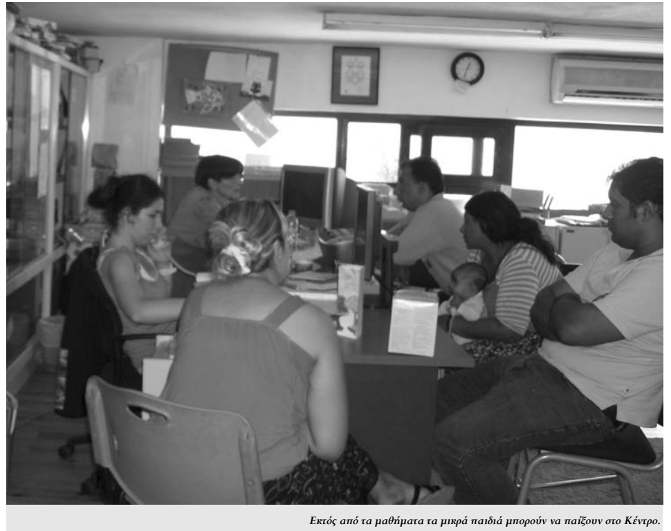
Εκτός από τα μαθήματα τα μικρά παιδιά μπορούν να παίξουν στο Κέντρο.

Τους παρέχουμε βοήθεια για επαγγελματικό προσανατολισμό και ψυχοκοινωνική υποστήριξη. Βοηθήσαμε πολλά παιδιά, επίσης, να πάρουν απολυτήριο Δημοτικού, για να μπορούν να βγάλουν ναυτικό φυλλάδιο για να δουλέψουν.