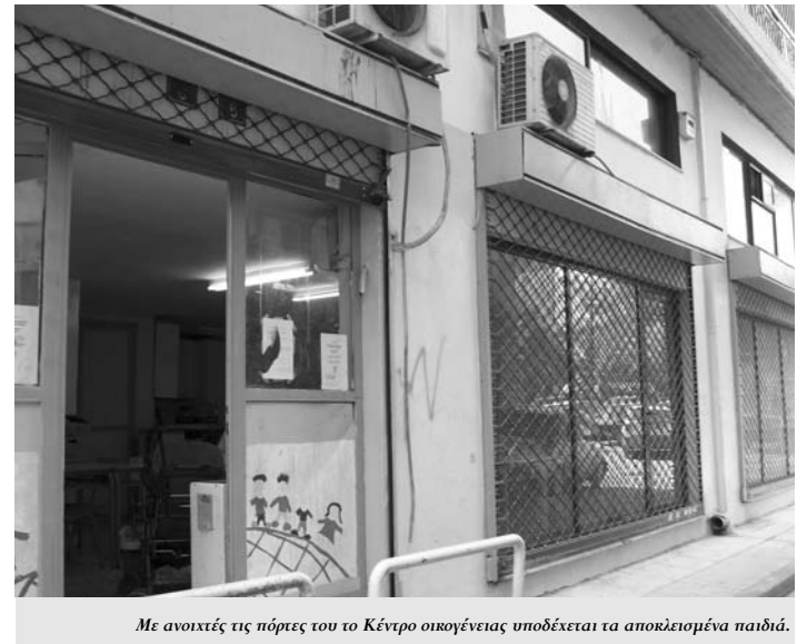
Με ανοιχτές τις πόρτες του Κέντρου οικογένειες υποδέχεται τα αποκλεισμένα παιδιά.