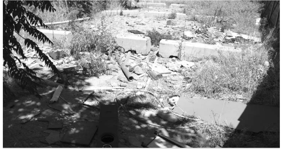
Σκουπίδια διάσπαρτα αντί για ανάδειξη του όμορφου χώρου στην Ακαδημία Πλάτωνος

«Προσπαθούμε, βρε Τζιμ, με κάθε τρόπο να αλλάξουμε αυτή την άθλια κατάσταση. Ούτε και σε μένα αρέσει αυτό το τοπίο. Γνωρίζω ότι μπορεί να γίνει ένα από τα στολίδια της Ελλάδας και να το χαίρεται όλος ο πλανήτης».