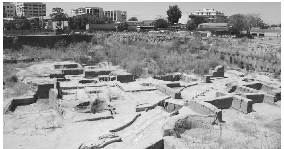
Οι ανασκαφές γίνονται μόνο όταν προβλέπεται η ανέγερση μεγανθυρίων που θα καταστρέψουν την αρχαία κληρονομιά.