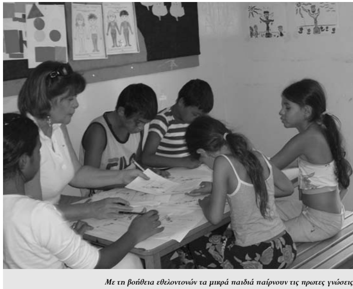
Με τη βοήθεια εθελοντών τα μικρά παιδιά παίρνουν τις πρώτες γνώσεις.