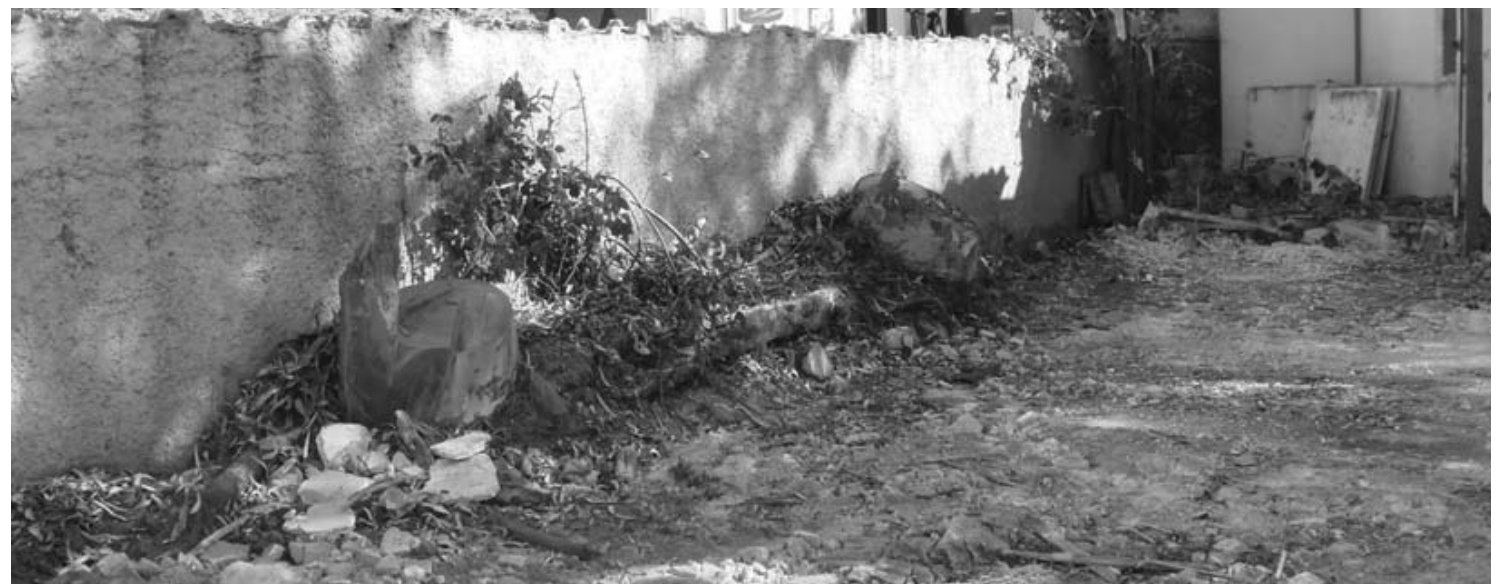
Πόσο κοστίζει μια ανάσα; Εύκολο. Μόλις 60 ευρώ. Αυτό είναι το ποσό που πληρώνουν όσοι κόβουν δέντρα - μικρά ή αιωνόβια, μικρή σημασία έχει για την κεντρική εξουσία. Μόλις 60 ευρώ για ανάσες ζωής και οξυγόνου που κάνουνται στην πόλη. Και οι υπολογισμοί γίνονται κυνικοί. Κόβεις τέσσερις ευκαλύπτους στη γειτονιά, έτσι, γιατί θέλεις να ρίξεις τοιμήνιο. Κανένα πρόβλημα. Πληρώνεις το πρόστιμο, αν γίνει καταγγελία -ποτέ βεβαίως- και καθάρσιες. Η ζημιά στο περιβάλλον, το πράσινο, το οξυγόνο στη γειτονιά μας πόσο άραγε αποιμάται;