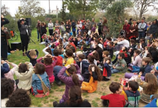
ΦΩΤΟ: ΓΙΩΡΓΟΣ ΤΣΙΟΡΒΑΣ