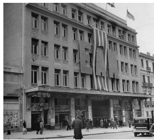
Πάνω: η σημερινή πλατεία του Σωτήρη Πέτρουλα όπως ήταν το 1950 (πλατεία Μεταξά). Στη μέση το κτίριο του ΕΑΜ. Κάτω: Ηρώ των αγωνιστών της Εθνικής Αντίστασης.

Οποιοσ ξεχνάει την ιστορία του είναι υποχρεωμένος να τη ξαναζήσει. Αφιερωμένο στη γενιά αυτής της γειτονιάς που βίωσε τη γερμανική Κατοχή και τώρα, στη δύση της ζωής της, της μέλει να ξαναζήσει το σήμερα, ίσως σε μια από τις πιο δύσκολες στιγμές της ιστορίας μας.