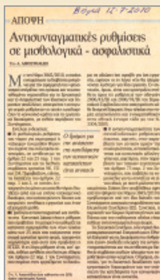
Δημοσιεύθηκε στο βήμα 15.7.2010

Με τον Νόμο 3845/2010, ο οποίος ενσωμάτωσε τα διαβόητα μνημόνια για την εφαρμογή του «μηχανισμού στήριξης» της τρόικας και τα κατατεθειμένα νομοσχέδια για το Εργασιακό και το Ασφαλιστικό των ιδιωτικών και δημοσίων υπαλλήλων, επιχειρείται η εισαγωγή σειράς ρυθμίσεων οι οποίες κατεδαφίζουν το κοινωνικό κράτος και τα εργασιακά δικαιώματα, με ευθεία παράβαση του Συντάγματος.