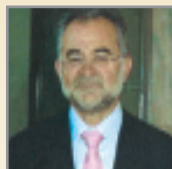
Του Λ. ΑΠΟΣΤΟΛΙΔΗ

• Πρόδηλα αντισυνταγματική και αντίθετη στο Κοινωνικό Δίκαιο είναι η ρύθμιση που προβλέπει ότι μπορεί να καθορίζεται κατώτατο ημερομίσθιο των νέων ηλικίας κάτω των 25