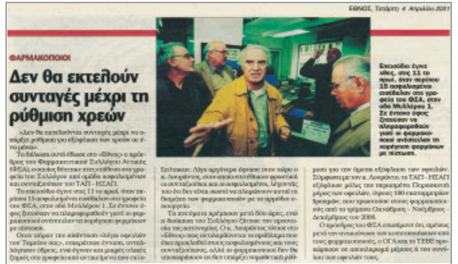
Από την κατάληψη των γραφείων του φαρμακευτικού Συλλόγου ΑΤΤΙΚΗΣ το 2001.

Μπορεί σε πολλά ζητήματα να κάνουμε υποχωρήσεις και ότι δεν καταλαβαίνουμε, στο θέμα όμως αυτό που έχει άμεση σχέση όχι μόνο με την υγεία πολλών συναδέλφων μας, αλλά και με τη ζωή τους ακόμα, δεν επιτρέπουμε σε κανέναν να παίζει και πολύ περισσότερο να αδιαφορεί.