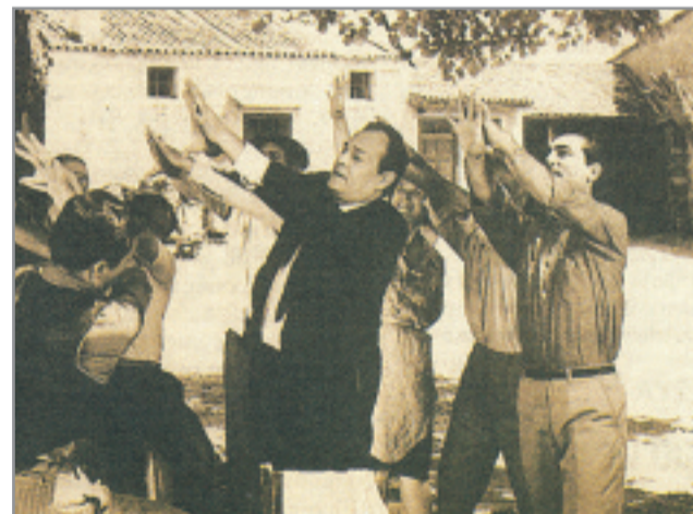
Ο Μαυρογαλαούρος στέλνει «χαιρετίσματα» στην εξουσία.