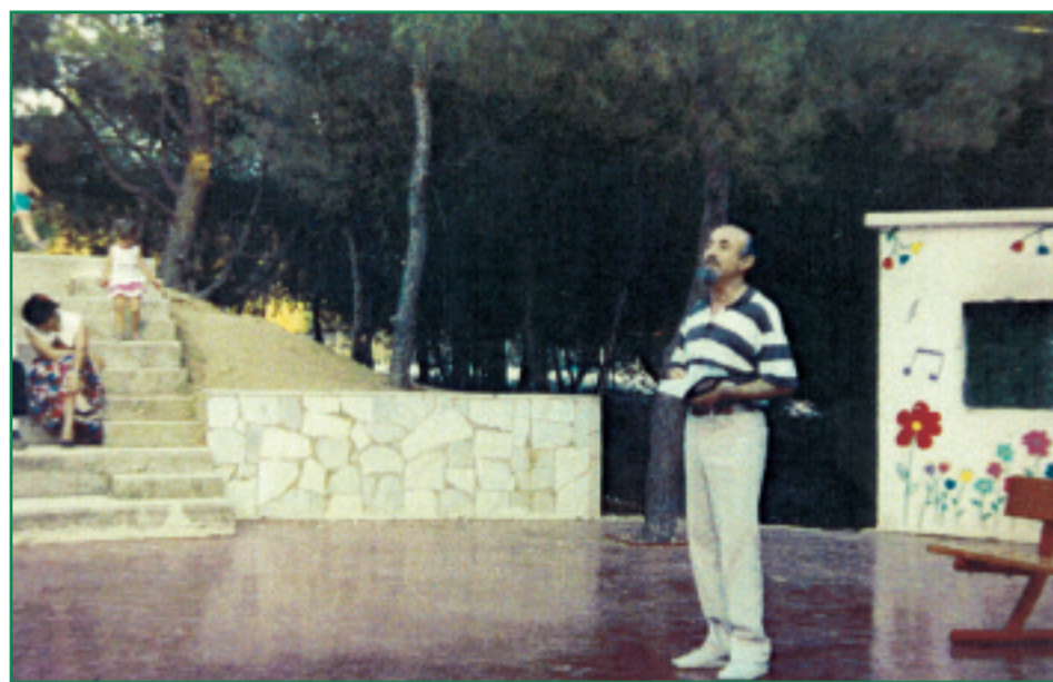
Συγκέντρωση Γονέων στο θεατράκι. Ομιλία στους γονείς μετά το επισκεπτήριο. 24 Ιουνίου 1990

Αρχίζω να ετοιμάζομαι για την αναχώρηση. Όταν βρίσκω καιρό τακτοποιώ