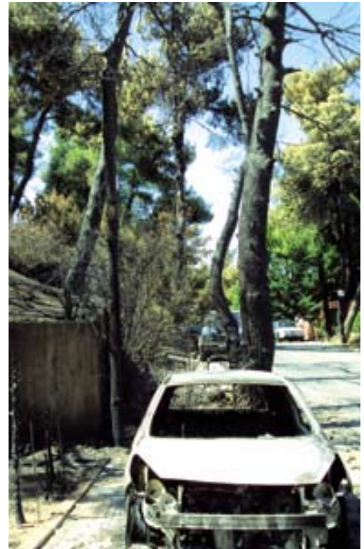
Άλλο ρεπορτάζ για τις φωτιές στις σελίδες 18-19