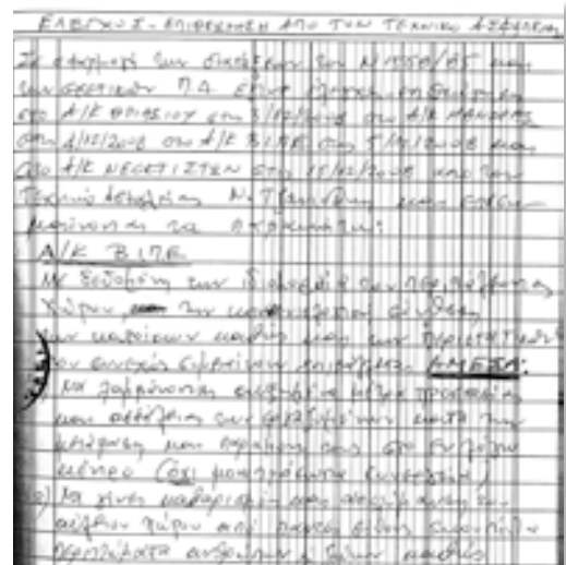
Απόσπασμα από την έκθεση - επιθεώρηση του Τεχνικού Ασφαλείας. Οι άνθρωποι καταγράφουν μια σειρά από μέτρα που πρέπει να παρθούν άμεσα για την ασφάλεια των εργαζομένων. Φωνή βωώντος εν τη ερήμω...

Πριν από οκτώ μήνες έγινε σύσκεψη (24/2/09) στο Διοικητικό Μέγαρο (κ. Κα-