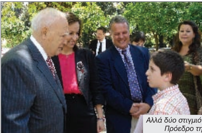
Αλλά δύο στιγμιότυπα στοργικά με τον Πρόεδρο της Δημοκρατίας.