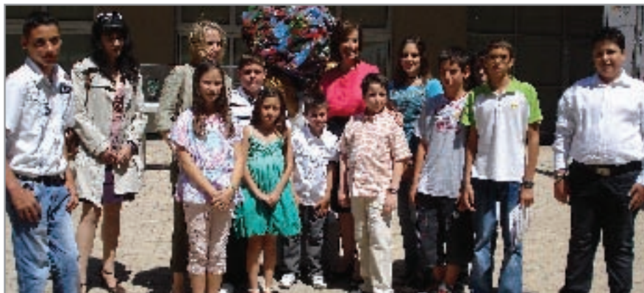
Όλα μαζί τα βραβευμένα παιδιά μαζί με τις υπουργούς Περιβάλλοντος και Παιδεία σε μια αναμνηστική φωτογραφία.