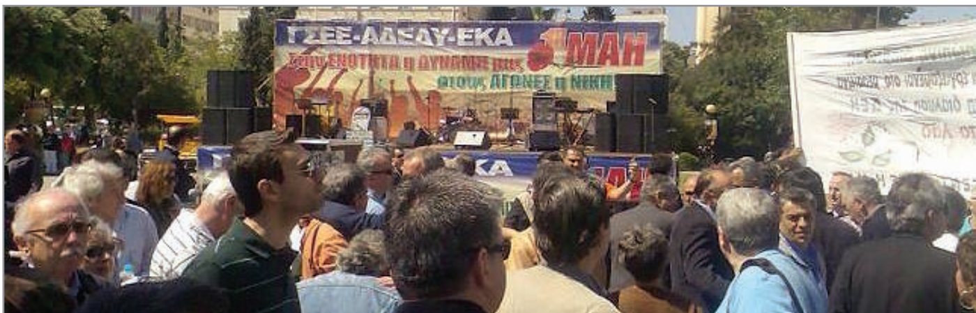
Φωτογραφία από την κεντρική πρωτομαγιάτικη απεργιακή συγκέντρωση της ΓΣΕΕ στην πλατεία κλαυθμώνος όπου συμμετείχε και η ΠΕΤ - ΟΤΕ.