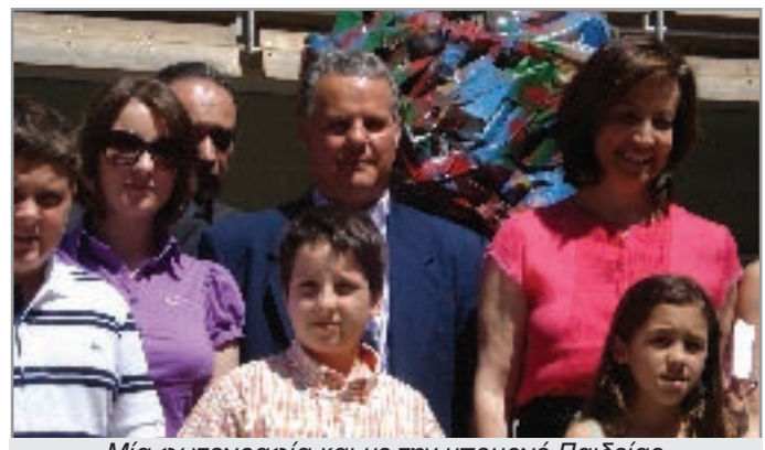
Μία φωτογραφία και με την υπουργό Παιδείας κ. Διαμαντοπούλου.