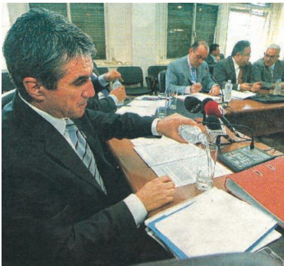
- Λίγο νερό, χρειάζεται...