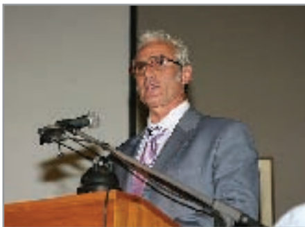
Ο Πρόεδρος της ΠΕΕ - ΟΤΕ Γιάννης Πάγκαλος

Η αιτία που προέβλεπε ήταν πως αποτελούν παρασιτικό οργανισμό στα πλαίσια της κοινωνίας μια και η παραγωγή τους δεν έχει ζωτική αξία για την επιβίωση του ανθρώπου και πως καταναλώνουν πόρους καθαρά για πολυτέλεια άνευ ουσίας.