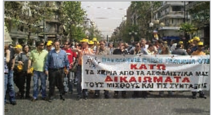
Συνδικαλιστικά στελέχη της ΠΕΤ ΟΤΕ στην μεγάλη απεργιακή κινητοποίηση των ΓΣΕΕ –ΑΔΕΔΥ της 5 Μάη μπροστά στο πανό μας.