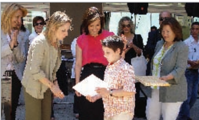
Η υπουργός Περιβάλλοντος κ. Μπιρμπίλη δίδει τον έπαινο.