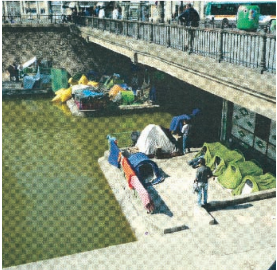
Πλαστικά καλύμματα πρόσκαιρης ευτυχίας κι από πάνω φιλήσυχοι πολίτες αγναντεύουν το αξιοθέατο. Μπαλκόνι στα βρόμικα νερά του Σηκουάνα. Άστεγοι στη Γαλλία. Θα το δούμε κι εδώ αυτό το φαινόμενο τις μέρες που θάρθουν;