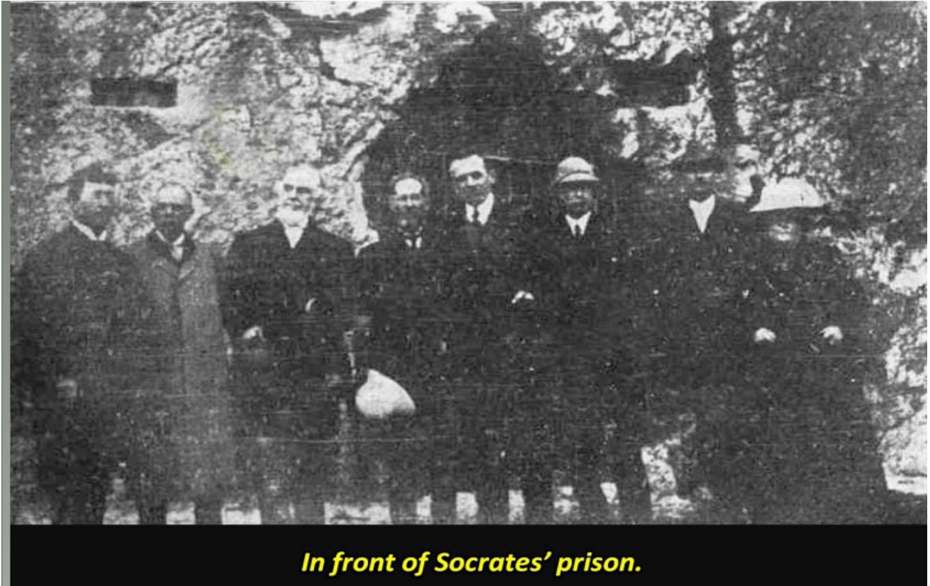
Μπροστά στην φυλακή του Σωκράτη

Κατεβαίνοντας από τον λόφο μπήκαμε στις άμαξές μας και οδηγηθήκαμε σε άλλο λόφο, τον οποίο ο Δημοσθένης και άλλοι σημαντικοί άνδρες του παρελθόντος χρησιμοποίησαν για να κάνουν πολιτικές ομιλίες. Στη συνέχεια επισκεφτήκαμε μια παλιά φυλακή, όπου κρατήθηκε ο Σωκράτης και στην οποία αυτοκτόνησε 4 πίνοντας κώνειο δηλητήριο.