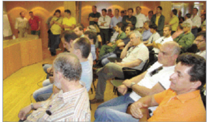
Από τη συνέντευξη τύπου του Προέδρου της ΓΕΝΟΠ και της ΕΤΕ για τα θανατηφόρα ατυχήματα και την έλλειψη προσωπικού

τρα ασφάλειας σε θέματα γειώσεων εργασίας ή άλλων αυθαιρεσιών. (Το δικαίωμα αυτό θα πρέπει να προβλέπεται από τις σχετικές συμβάσεις με σαφή και κατάδηλο τρόπο και να μπορεί να είναι αμετάκλητο από Περιφερειακό επίπεδο παρά μόνο από την Γενική Διεύθυνση Διανομής).