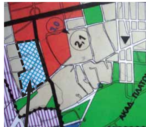
ΧΑΡΤΗΣ 2Β Εκεί όπου το Γενικό Πολεοδομικό Σχέδιο προέβλεπε αθλητικές εγκαταστάσεις, τώρα προτείνονται Οικοδομικά Τετράγωνα