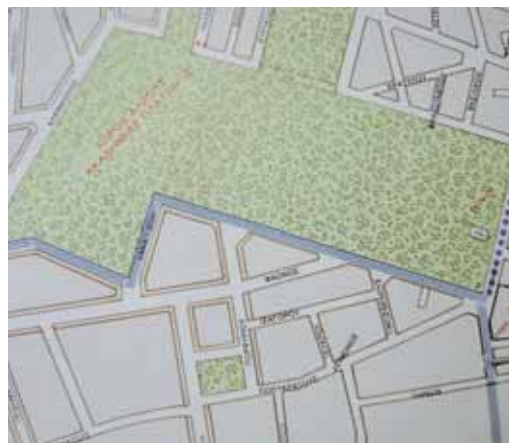
ΧΑΡΤΗΣ 1Α ΧΑΡΤΗΣ ΔΙΑΜΕΡΙΣΜΑΤΟΣ Η μελέτη του Δήμου στο νότιο όριο του Αρχαιολογικού χώρου απλά «τακτοποιεί» το σχέδιο πόλης 1968