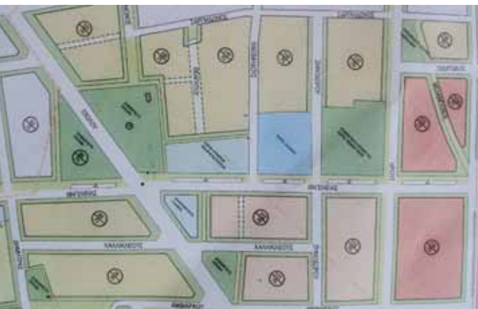
ΧΑΡΤΗΣ 2 Η ΠΡΟΤΑΣΗ ΜΕΛΕΤΗΣ ΤΟΥ ΔΗΜΟΥ

Το παραπάνω κείμενο έστειλε η Επιτροπή Κατοίκων της Ακαδημίας Πλάτωνος προς τη Διεύθυνση Σχεδίου Πόλεως του Δήμου Αθηναίων