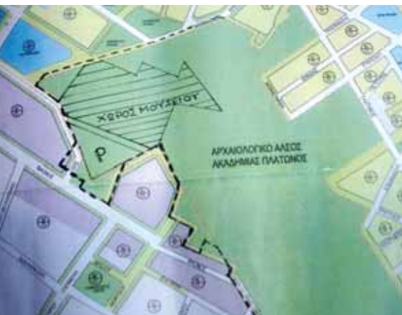
ΧΑΡΤΗΣ 1 ΠΡΟΤΑΣΗ ΜΕΛΕΤΗΣ ΔΗΜΟΥ Αποτυπώνουμε το θεσμοθετημένο όριο του αρχαιολογικού χώρου (---) και το χώρο του νέου Μουσείου