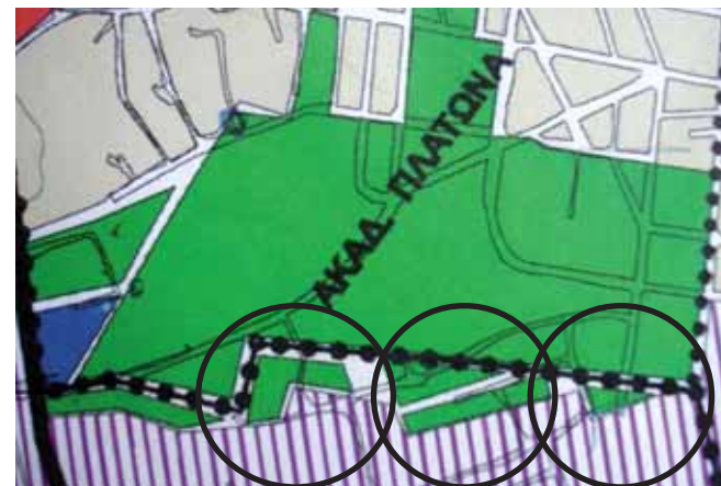
ΧΑΡΤΗΣ 1Β ΓΕΝΙΚΟ ΠΟΛΕΟΔΟΜΙΚΟ ΣΧΕΔΙΟ ΔΗΜΟΥ Η μελέτη του Δήμου δεν παίρνει υπόψη τις προβλέψεις του Γενικού Πολεοδομικού Σχεδίου του Δήμου στο νότιο όριο του Αρχαιολογικού χώρου.