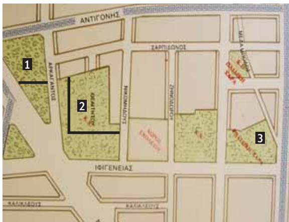
ΧΑΡΤΗΣ 2Α Το παλιό ρυμοτομικό του 1968 (Λαχανόκηποι). Σημειωμένοι οι κοινόχρηστοι χώροι που χάνονται στη πρόταση του Δήμου (1, 2, 3)